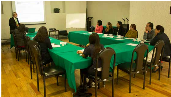
Los asistentes a este curso tuvieron además, la oportunidad de plantear sus dudas sobre el tema.

Los principales temas abordados fueron: Contratación; Subcontratación ( outsourcing ); Aspectos laborales relevantes dentro del Marco Jurídico; La prueba y su preconstitución; Rescisión de la relación de trabajo; y Plazos y procedimientos para la terminación de la relación de trabajo.