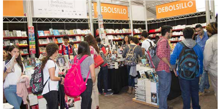
Jóvenes recorren con entusiasmo las instalaciones de la FIL IPN.

Resaltó que dicha cooperación ha sido fructífera y ha permitido que se fortalezca en ámbitos de gran trascendencia como el académico, como lo demuestran los convenios de cooperación, en particular el de intercambio de estudiantes, suscritos el pasado 28 de febrero entre el Politécfnico y la Universidad de Hiroshima.