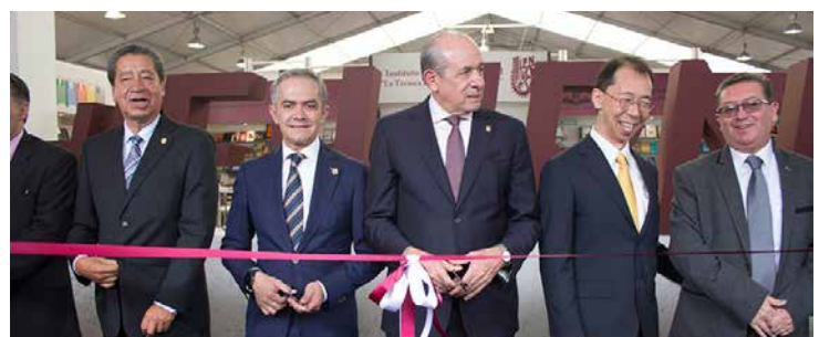
Miguel Ángel Mancera acudió a la inauguración de la XXXVI FIL IPN en Zacatenco.