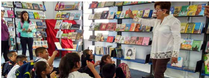
Actividades de la carpa “Libros para Todos”