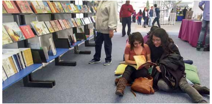
La carpa "Libros para Todos" abre sus actividades a todas las edades.