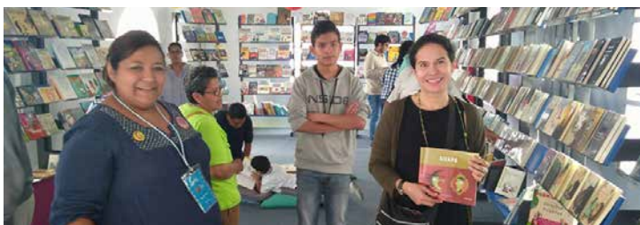
Arcelia Ramírez, actriz, visita la carpa “Libros para Todos”

Además de la exhibición y venta en la carpa, el programa de participación de la CANIEM a través del COLIJ, incluye talleres-presentaciones de libros dentro del programa de coediciones de la Secretaría de Cultura con el tema de inclusión: “Todos somos diferentes”, “Querido Pájaro”, “La declaración de los derechos de las mamás y la declaración de los derechos de los papás”, “Frida y Diego en el país de las calaveras”, “Lectura y escritura creativa”, “52 preguntas sobre la Tierra y el espacio”, “La isla de los lagartos”, y “Luis Braille. El mundo conectado por seis puntos”. Cada uno considera de 6 a 8 sesiones, con una duración de 50 minutos cada una, a fin de atender a un mayor número de visitantes a la feria.